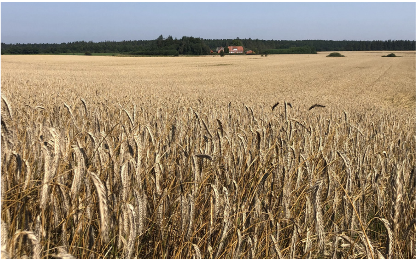
Store monotone dyrkningsflader underminerer livsgrundlaget for mange af de vildtarter, som ellers har tilpasset sig landbrugslandskabet (som det var engang). Denne udvikling sker, når levende hegn, vejrabatter, markskel osv. fjernes og opdyrkes.

Det handler altså om at skabe og sikre variationen i landskabet, så vi igen kan få sammenhængende og velfungerende fødekæder i landbrugslandet. ran@jaegerne.dk