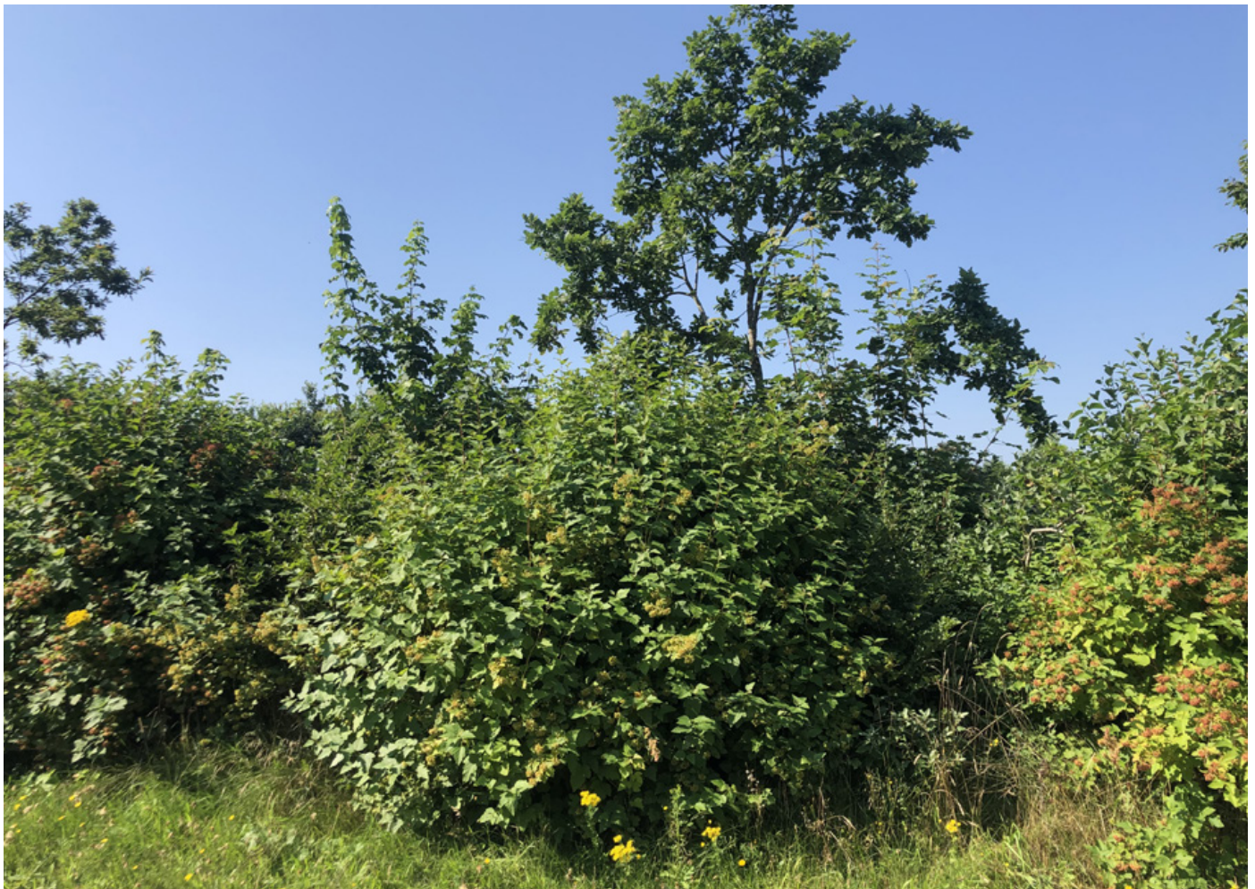
Ønsker man at sikre store solitære bestandstræer og tætte krat i sine levende hegn og remisser, er pleje en nødvendighed. Uden pleje gror beplantningerne sig mørke og åbne i bunden uden læ og dækning til vildtet.

hvad enten det er af kommunerne eller private lodsejer, kan være meget problematisk, da dette ofte gøres i juni måned, hvor der stadig er mange fugle, som yngler der. Når græs- og urtevegetationen slås, jamen, så ryger æg, yngel og nogle gange de voksne fugle med i købet, hvilket er meget uheldigt og uhensigtsmæssigt. Når rabatterne klippes, misser man også det fantastiske blomsterflor, som der kunne være, hvis de blot havde fået lov til at passe sig selv, og resultatet er, at vegetationen i grad højere grad bliver domineret af græsser, hvilket betyder forringelse af levevilkårene for de bestøvende insekter og mange andre arter. Man bør derfor meget kraftigt overveje, om det er nødvendigt at fjerne og ødelægge rabatterne på den måde. Behøver man overhovedet at gøre noget? Hvis man absolut vil slå vegetationen, kunne man så måske opnå det