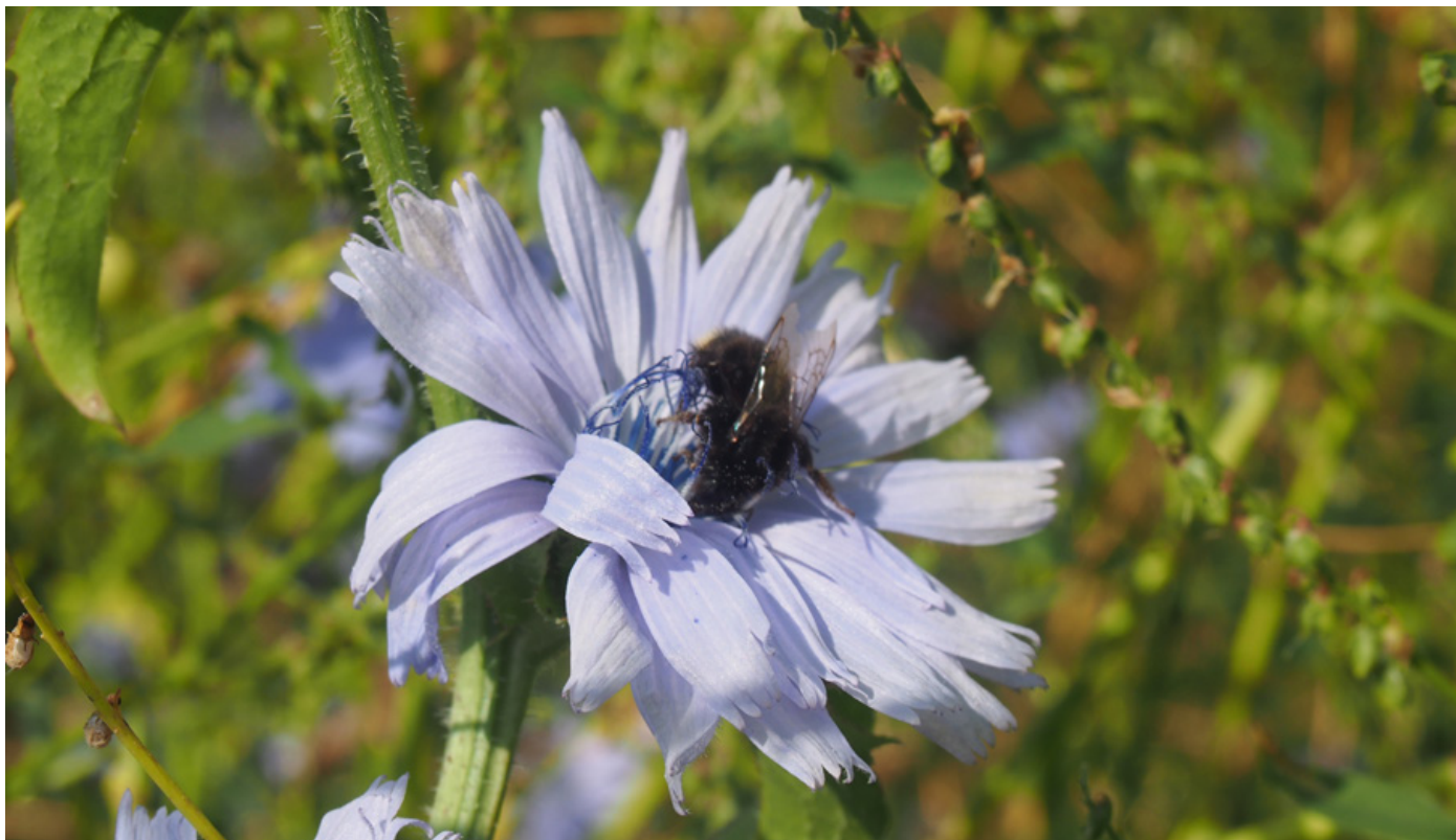
I visse markvildtlav skal der fremover også tælles udvalgte bestøvere. Tællingerne vil blive foretaget i samarbejde med Danmarks Biavlerforening.