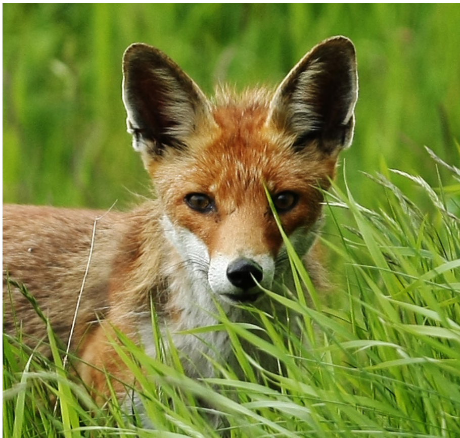
Ræven er bedømt som "næsten truet" på rødlisten, kan det være rigtigt? Vi mangler viden om udbredelsen af flere pattedyr og derfor opfordres alle jægere til at hjælpe med dataindsamling.

Vurderer man bestandene af råvildt, på samme måde som man har vurderet ræv, så er råvildt også truet i nogle egne af landet. Det er der vist mange af os, der færdes ude i naturen, som ikke helt genkender. På landsplan vurderes bestanden af råvildt dog også at være stabil, og DOF's punkttællinger viser en fremgang i bestanden, selvom udbyttet er faldende.